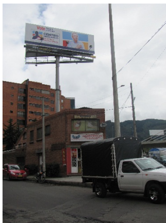
VISTA PANORÁMICA VALLA INSTALADA SENTIDO SUR - NORTE – ANUNCIA: VOTE SENADO Y CÁMARA CENTRO DEMOCRÁTICO